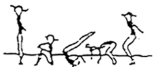
Rolamento à retaguarda (10%)