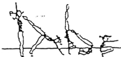
Apoio facial invertido, rolamento à frente (20%)

Construa uma sequência, com as diversas figuras, de forma a obter no mínimo 60% de média do valor global dos elementos técnicos.