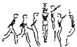
Corrida e salto em extensão com 1/2 volta (5%)