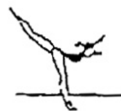
Posição de equilíbrio (5%)