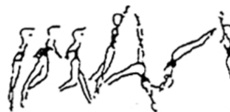
Salto de mãos à frente (10%)